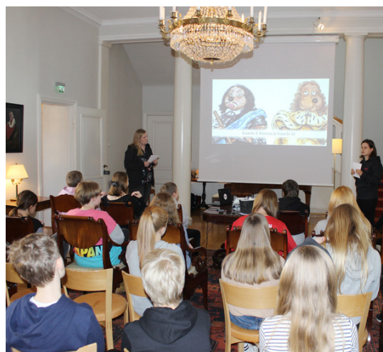
Barnevenemang på Sveriges ambassad år 2020.

Svenska nu öppnar fönstret till Norden för eleverna. Den regionala filmverksamheten,