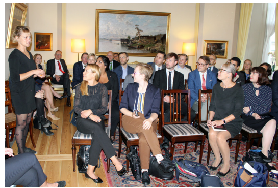
Svensk-finsk mötesdag i Stockholm år 2019.

År 2019 inledde Svenska nu ett projekt för att engagera politiska medarbetare i Finland och Sverige. Projektet utmynnade i en lyckad svensk-finsk mötesdag i Finlands ambassadors residens i Stockholm med aktuella föreläsningar och förtroliga bilaterala samtal. Mötesdagen upprepas våren 2021 och den äger den här gången rum på Sveriges