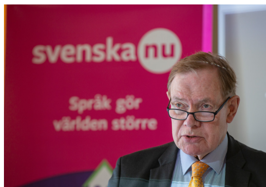
Delegationsordförande Paavo Lipponen.

Svenska nu bereder en historik om nätverkets verksamhet med tanke på jubileumsåret 2022. Avsikten med historiken är att berätta nätverkets historia, men också förankra den till den förändrande språkpolitiken och språkli-